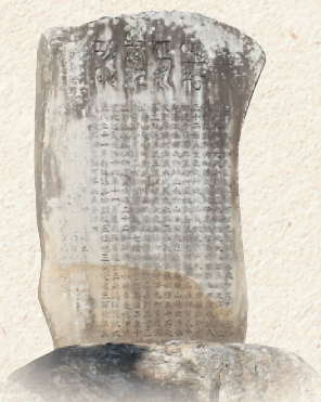
笠松左太夫の記念碑