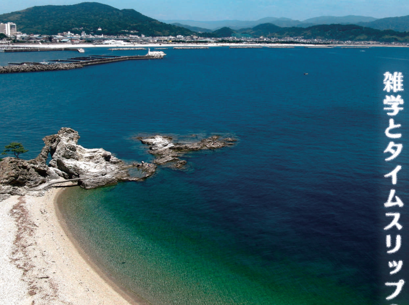
●蓬萊岩を臨む和歌浦の風景