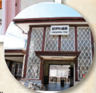
⑩ JR 紀伊中ノ島駅 《1935 (昭和10) 年建設》 モダンな斜め格子の駅舎。 旧 官営八幡製鉄所で操業当初 (100年以上も昔)に製造された古いレールが、 ホームの屋根を支えている柱や梁に使用されて いる。推薦産業遺産 (産業考古学会)。