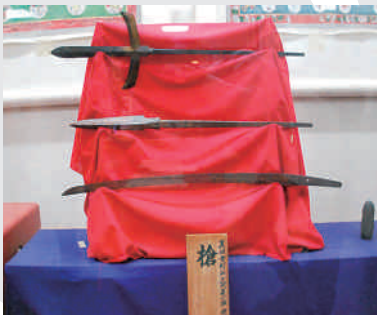
幸村公が使用したと伝えられている槍先

真田幸隆の三男として生まれる。智謀を駆使して戦国時代を生き抜き、豊臣秀吉からは「表裏比興の者」と評されていた。関ヶ原の戦いで西軍が敗れた後、幸村とともに九度山に流され、そこで生涯を終える。