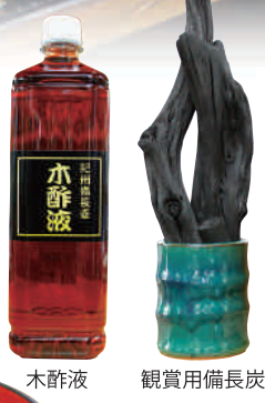
木酢液 観賞用備長炭

日高川町は紀州備長炭生産量の日本一を誇る。売店ではその紀州備長炭をいかした観賞用備長炭や木酢液に人気があり、山里ならではの椎茸や鮎、あまごも販売している。また特産物であるホロホロ鳥の冷凍肉をはじめ、特徴ある水玉模様羽をあしらったコサージュなど、ここでしか手に入らない逸品も魅力的だ。