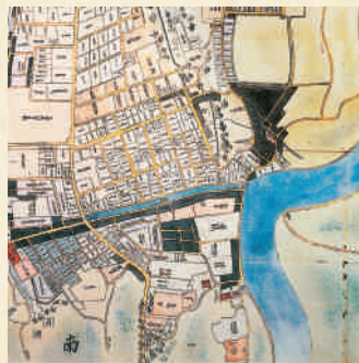
●江戸時代の堀止付近

め、堀を作るのを止めた。そこから名付けられたとされている。また、浅野家から徳川家に代わり三十七万石の城下町が五十五万石まで広がる