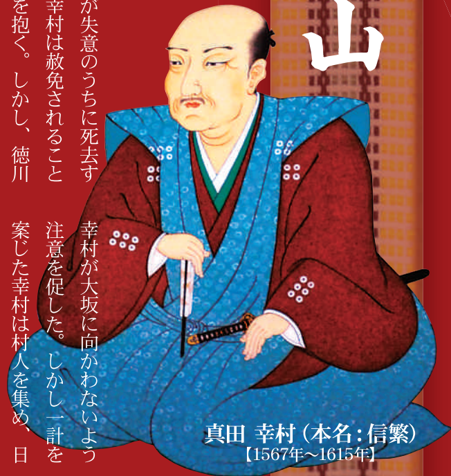
真田 幸村 (本名: 信繁) 【1567年~1615年】

大名時代の優雅な生活水準を保っていた九度山での生活は、金銭面で大変苦しいものだった。生活費の多くは兄の信之や家臣からの仕送りに頼っていたが、それだけでは足りず、従者は日々金策に走りまわっていた。現存する手紙からは、親戚にお金を無心したり、家臣に焼酎をねだったりと、猛将のイメージとはかけ離れた幸村がみうけられ、身近に感じる事ができる。生活費の足しにと昌幸、幸村の家族が織っていた紐が堺の商人を通じて全国に販売され「真田紐」として好評を得ることとなる。