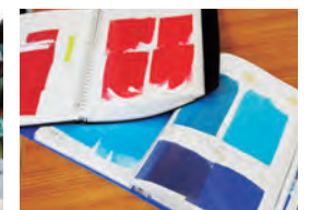
過去の調合をレシピ化