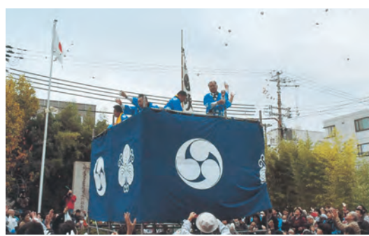
水門吹上神社の餅投げ

江戸時代の終盤に成立した『名所図会』には、水門吹上神社（和歌山市）の餅投げの風景が描かれている。「牛の舌餅」という大きなのし餅を屋根の上から投げ、多くの人が群がるその様子からは、人々が待ち望んだ一大イベントだったことがうかがわれる。 戦後の盛り上がり そんな餅まきイベントも、戦時中には中止されることになった。その後、全国的にはあまり見られなくなったが、和歌山では、戦後の復興にあわせて、各地でこれまで以上の盛り上がりを見せることになった。 農業にかかわりの深い新嘗祭や初午などの祭りに加え、建物が完成した時の上棟式、地蔵盆の厄除けなど。その場面は宗教行事だけにとどまらず、年中、どこかの場所で餅