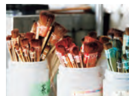
色ごとに変える刷毛