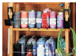
染料の配合は無量大