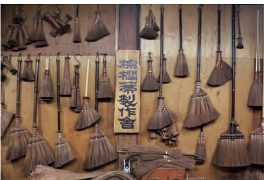
棕櫚箒製作舎 URL https://shurohouki.jp

伝統を守る事は大事だが、それに縛られてはいけない。現在は住環境も多様で、お客さんによつ