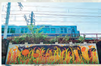
▲藤並駅付近の壁画